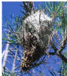
Nid sur branche