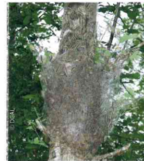
Nid sur branche